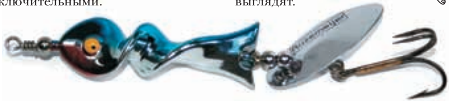
Можно ли говорить об этой приманке как о вращающейся блесне? Curly Killer – одно из причудливых творений Бертуса Роземайера.

шук в настоящее время выпускаются настоящие силиконовые монстры. Большинство “щукарей” мягкую пластиковую приманку в 18 см уже считают крупной, а эти приманки имеют длину 50 см и больше. Но тот, кто их использует, знает, что на них можно ловить отличных шук. Я в течение недели испытывал такого силиконового монстра и поймал 23 щуки, из них только три были меньше 90 см. Длина самой большой щуки была 1,28 м. После этого приманки перестали считаться крупными или какими-то странными, или исключительными.