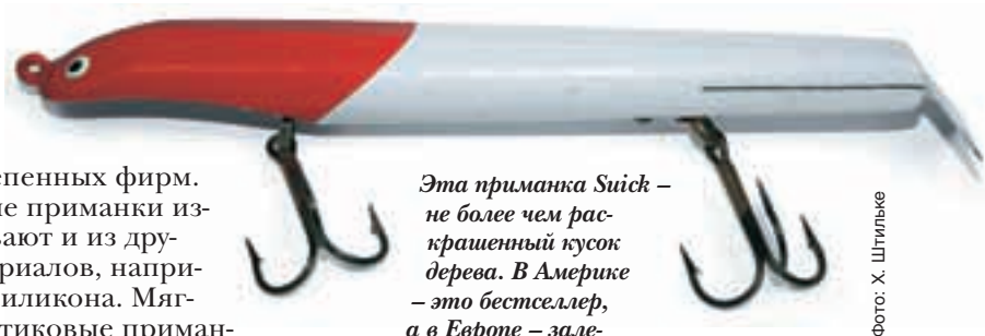
Эта приманка Suick – не более чем раскрашенный кусок дерева. В Америке – это бестселлер, а в Европе – залежалый товар.