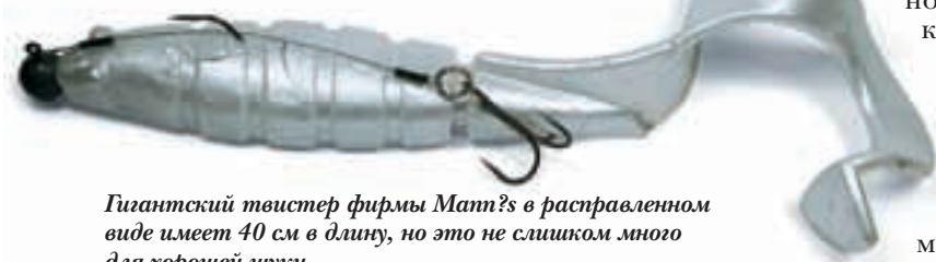
Гигантский твистер фирмы Matt's в расправленном виде имеет 40 см в длину, но это не слишком много для хорошей щуки.

Теперь я, например, использую приманку Suick. Это деревянный джеркбейт, который движется в воде зигзагообразно вверх и вниз. Этот джерк назы-