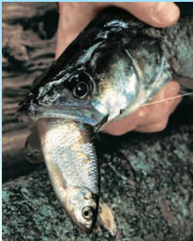
Судак хорошо ловится на крупную приманку, пока в воде нет больших стай мальков.

Curtis Atwater 6 Cranston Drive, Caledon East, Ontario, Canada, L0N 1E0 Tel: 905-584-0185. Fax: 905-584-0230. E-mail: atwaterfinearts@sympatico.ca. Website: www.natureartists.com/atwaterc.htm