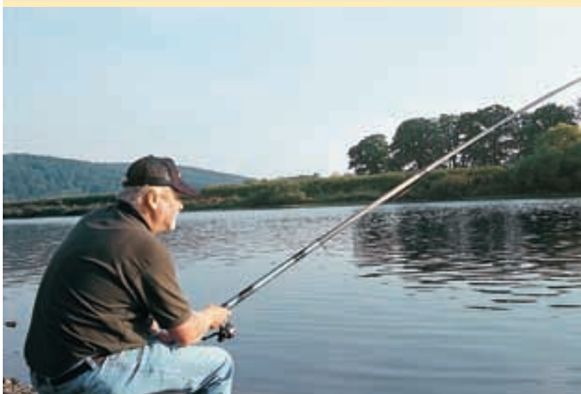
Ловля болонской удочкой – уловистый метод, если течение на водоеме не слишком быстрое и приманку можно протаскивать по чистому дну без препятствий.

металлический противозакручиватель Feederboom на основной леске, к которому подвешиваю кормушку. Он стопорится вертлюжком, к застежке которого я креплю петлю поводка. Выше вертлюжка устанавливаю еще резиновую бусинку. Она служит буфером и предохраняет узел от повреждения. Поскольку мы на многих водоемах можем рассчитывать на поимку усача в качестве дополнительного улова, основная леска не должна быть слишком тонкой. Нужна леска с разрывной нагрузкой от 3 до 5 кг. Хорошо подходят и тонкие "плетенки" диаметром 0,08 и 0,10 мм. Монофильный поводок должен иметь несколько меньшую