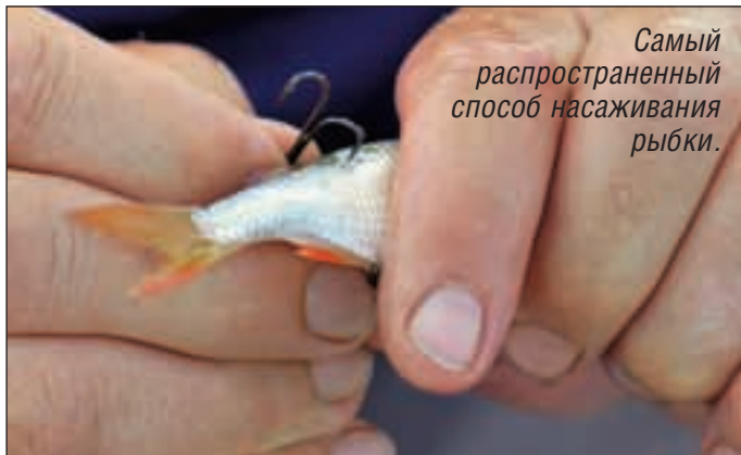
Самый распространенный способ насаживания рыбки.