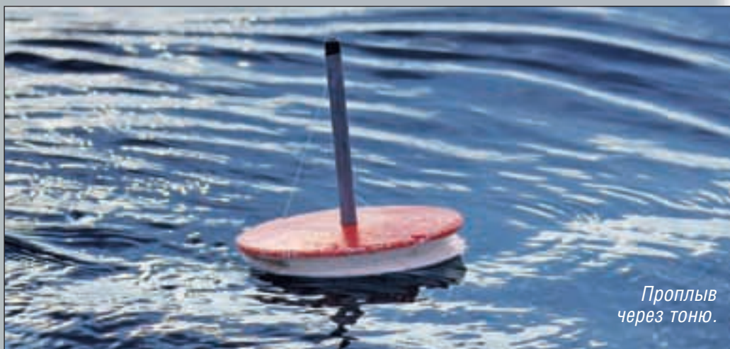
Проплыть через тую.

хороших судаков. Полагаю, что причиной такого отступления от правил в поведении хищника служило пустынное непроходимое побережье, заросшее ивняком, и полное отсутствие на