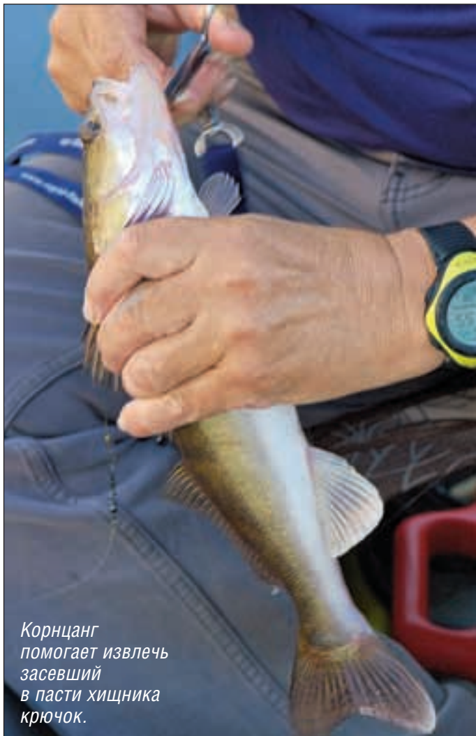
Корнцанг помогает извлечь засевший в пасти хищника крючок.

участках выше этой границы имеет смысл гонять кружки (подчас небезуспешно даже днем), установив рабочий спуск на полметра выше верхней границы русла.