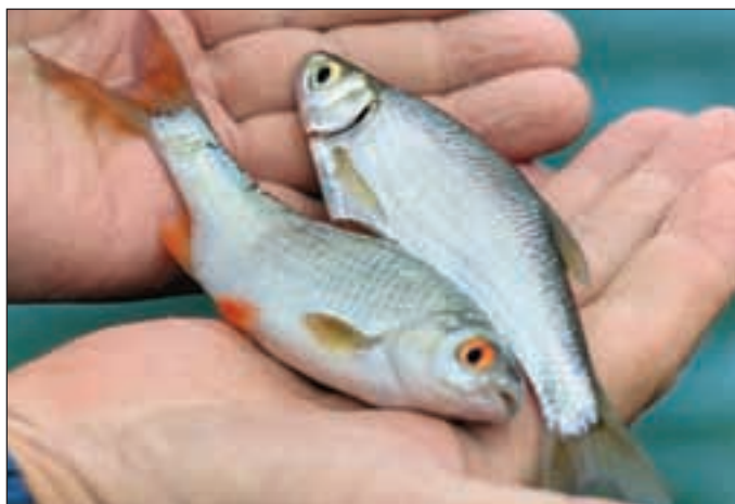
Живцы для «кlyкастого».

В июне, сразу после отмены двухмесячника охраны рыбных запасов, первую скрипку в симфонии утренней зари для кружочника играет, конечно, судак. Интерес представляют широкие полноводные озера и водохранилища, например волжского каскада, особенно те, что до недавнего времени были закреплены за различными обществами охотников и рыбаков. Эти водоемы ранее регулярно зарыблялись и маточным поголовьем, и мальками рыб различных видов, в том числе и судака. На больших реках гоньба кружков возможна лишь в обширных заводях или затонах, соединенных с рекой глубокими протоками. В некоторых водохранилищах основной помехой для гоньбы является судходство, где рыбацкие тони зачастую совпадают с фарватером движения скоростных «ракет», которые, разумеется, не свернут с курса при виде красно-белой «флотилии» кружков. С другой стороны, движение местных пассажирских судов начинается с того времени, когда июньский зоревой выход суда-