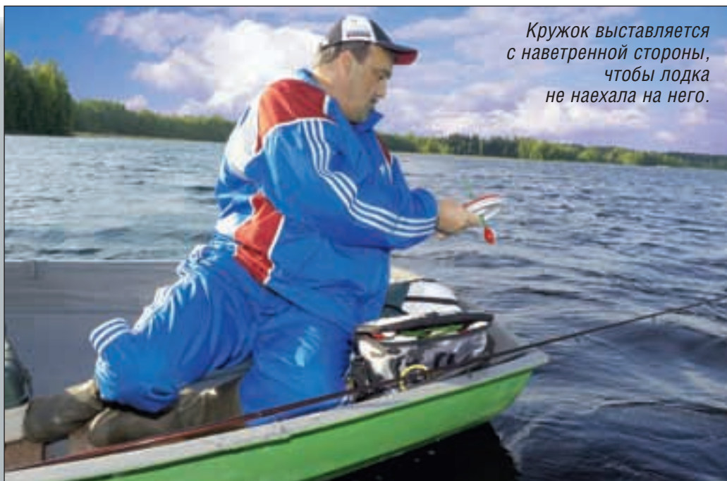
Кружок выставляется с наветренной стороны, чтобы лодка не наехала на него.