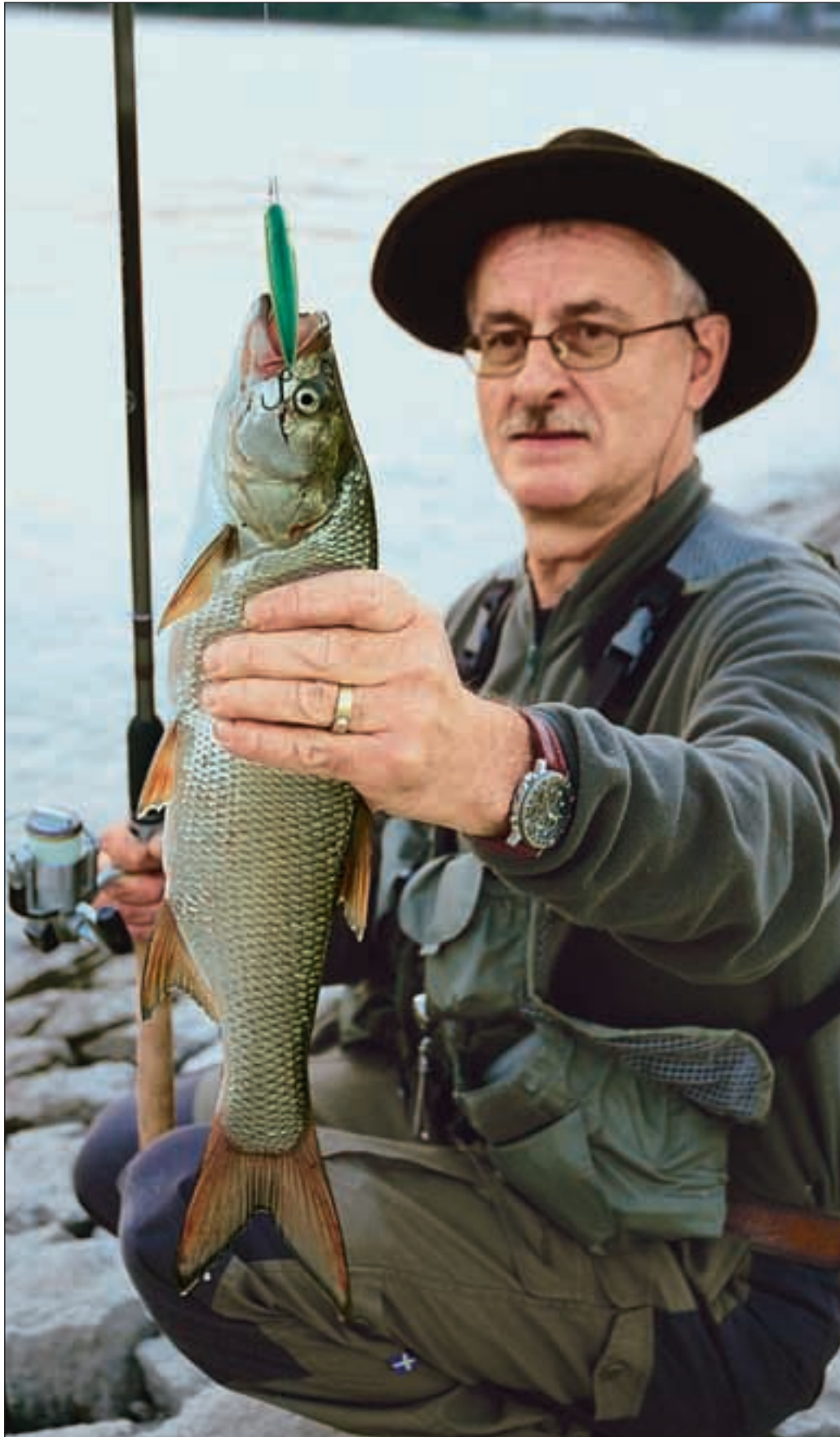
Монофильная леска на катушке дает меньше сходов, чем плетеная.

время года, когда рыбы стоят в глубоких зонах водоема, приманка с небольшим оттенком голубизны оказывается наиболее уловистой. Иногда я делаю ставку на светлые окраски, например на воблер с перламутровым брюшком и светло-коричневой спинкой. Поймав одного или несколько жерехов на модель приманки одного цвета, стоит попробовать приманку другого цвета. Жерех быстро становится подозрительным, и на приманки одного и того же цвета перестает брать.