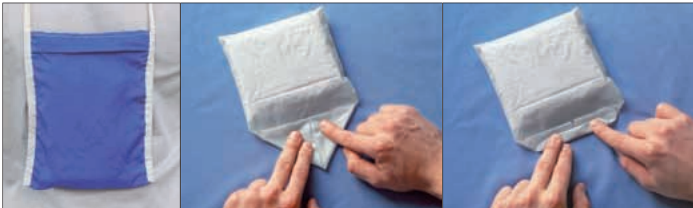
Так выглядит «волшебный мешочек».