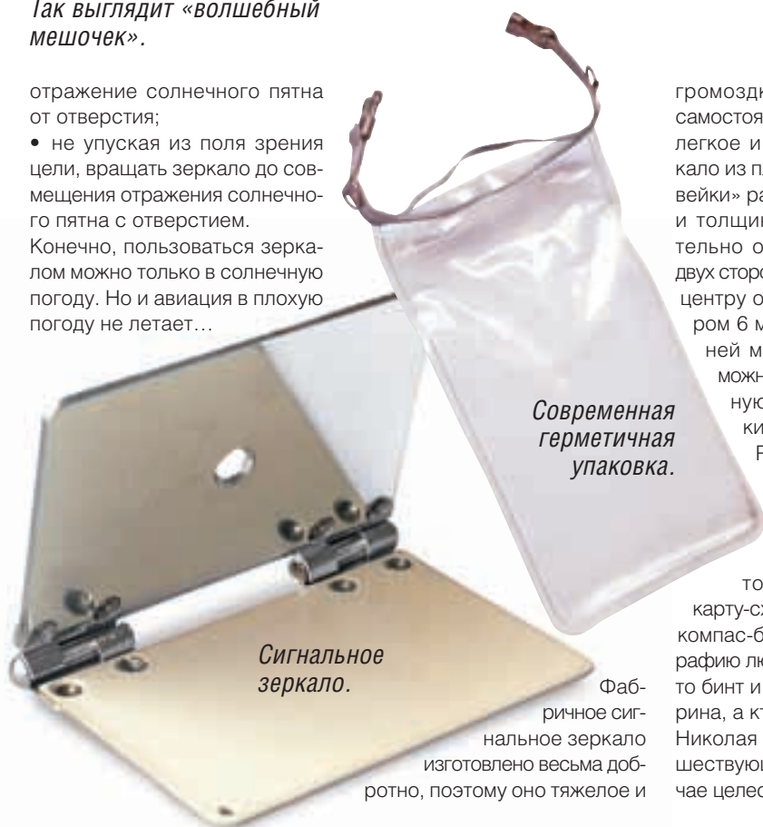
Современная герметичная упаковка.