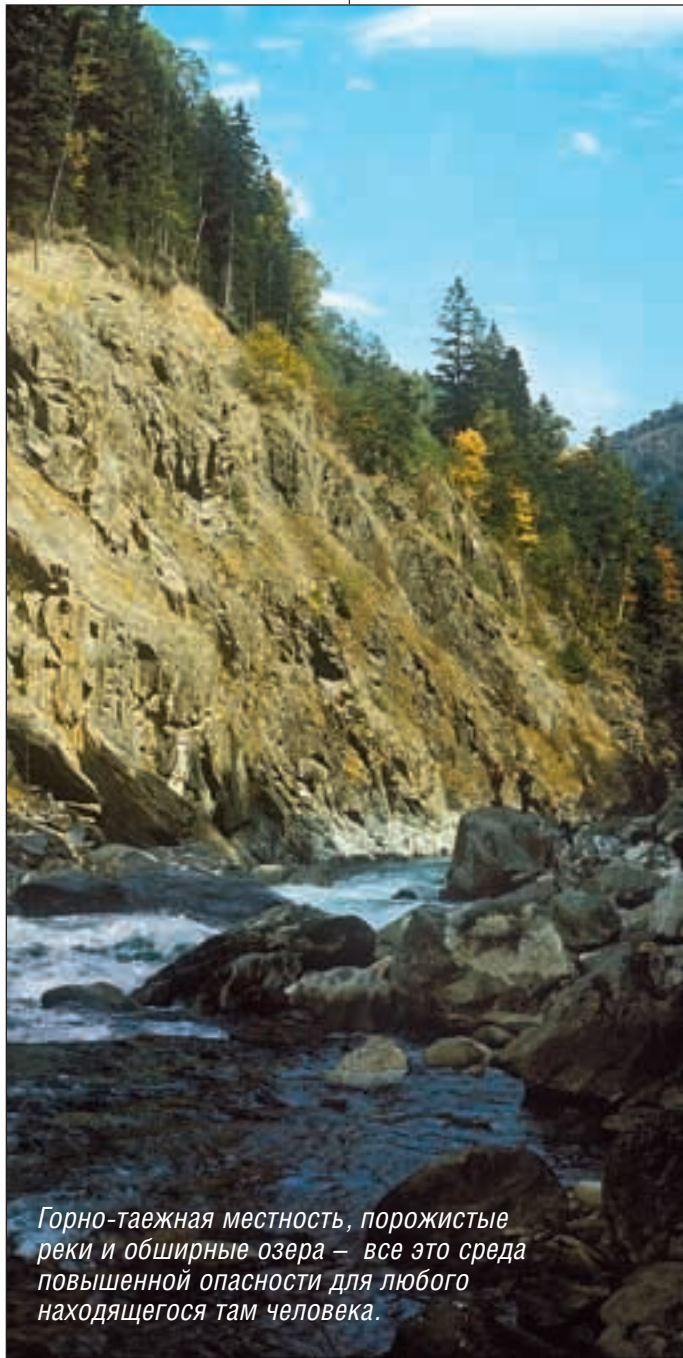
Горно-таежная местность, порожистые реки и обширные озера – все это среда повышенной опасности для любого находящегося там человека.

Безусловно, все сюрпризы, которыми природа может проверить человека на прочность, предугадать невозможно. Но путешественника, заранее подготовившегося хотя бы к наиболее вероятным неприятностям, любая неожиданность не застанет совсем врасплох. Недаром народная мудрость гласит: береженого бог бережет!