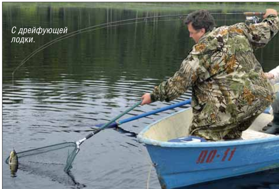
С дрейфующей лодки.