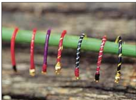
Уловистые имитации личинок комаров вязать несложно. Простые модели часто являются лучшим выбором.