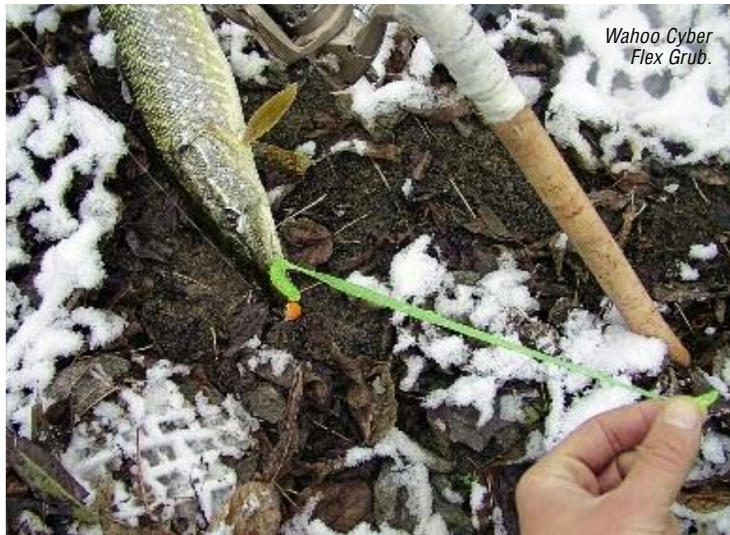
Wahoo Cyber Flex Grub.

Эта американская «резина» давно присутствует на нашем