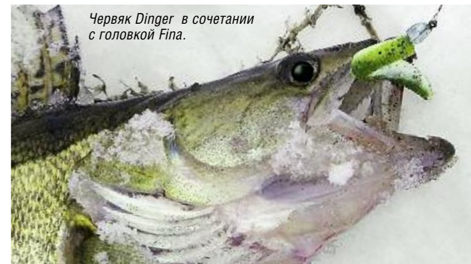
Червяк Dinger в сочетании с головкой Fina.

так как уровень подготовки у нас был немного разным, тем не менее можно было поставить приманке первую положительную, хотя и субъективную, оценку. В дальнейшем и в других похожих случаях я прослеживал некоторые очевидные признаки преимущества такой «резины» и на первое место поставил бы не фактор «съедобности», а конструктив-