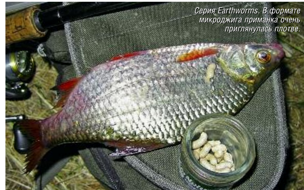
Серия Earthworms. В формате микроджига приманка очень приглянулась плотве.

ре с мормышкой или джиг-головкой при ступенчатой проводке у дна или в толще воды. Как правило, лучшим полигоном служат малые речки, но и на больших приманка иногда приносит очень интересные результаты. К примеру, при ловле жереха на отбойной струе «пелагическим» джигом. Серия Maxi Blood Worm – искусственный мотыль. Выпускается нескольких размеров, но если вы не собираетесь ловить пескаря, что тоже реально, то лучше взять покрупнее. На него в сочетании с джиг-головкой в малых реках ловится разнообразная «белая» рыба: голавль, карась, густера. Эффективным может быть сочетание мотыля с отводным поводком при ловле на больших реках, таких как Москва-река или Ока. На Москве-реке и Ахтубе мне, к примеру, удавалось неплохо ловить сопу в местах ее большого скопле-