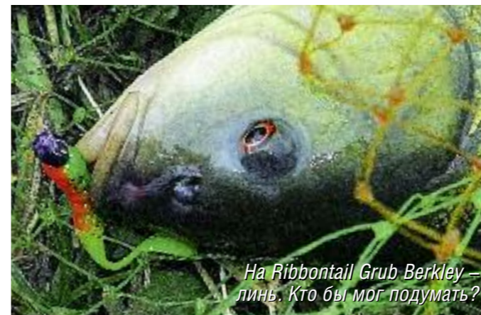
На Ribbontail Grub Berkley – линь. Кто бы мог подумать?

Серия Maggots – это белковые колбаски-червячки с очень выразительным запахом. Применял их и на «платниках». Помимо карпа, ловил осетров чиркающей проводкой по дну. Серия Power Maggot – искусственный опарыш. На него, помимо карпа и карася на «платниках», ловил очень много разнообразной рыбы на диких водоемах: голавля, жереха, уклейку, плотву, окуня, язя, леща. Приманка работает в па-