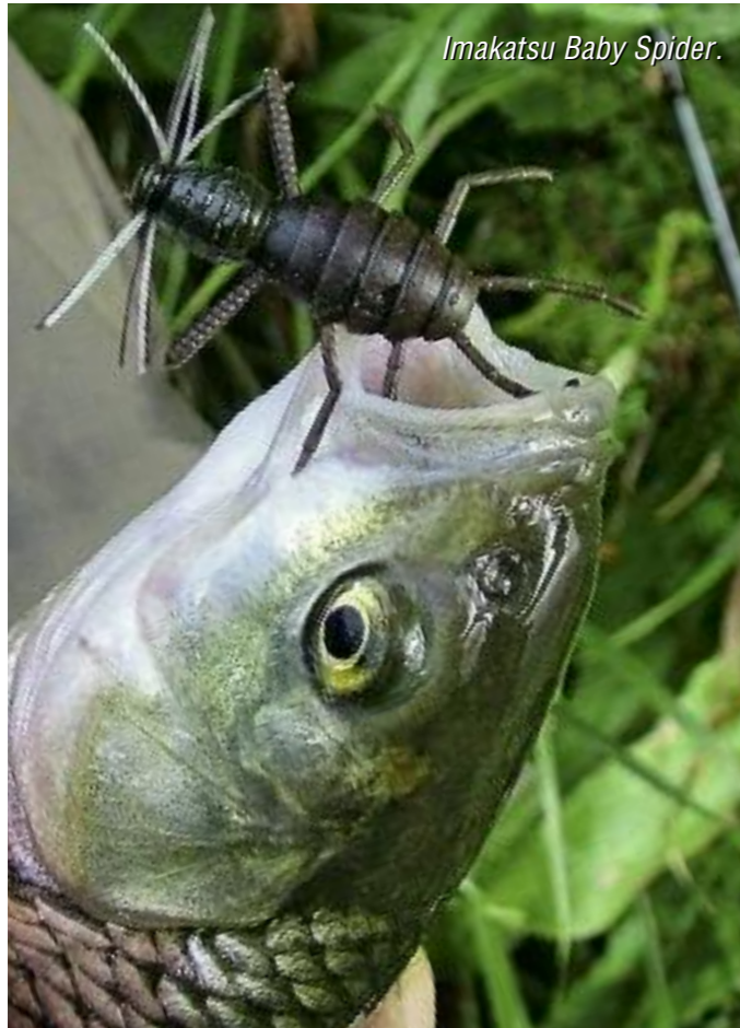
Imakatsu Baby Spider.

ров, но не менее интересным было то, что твистеры имели сильно выраженный запах. У многих он настолько «ядерный», что после контакта с приманками сразу хочется помыть руки. Случай проверить их эффективность представился осенью на Вазузском водохранилище. Мы ловили