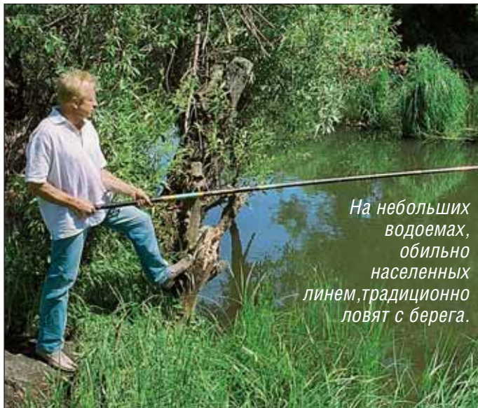
На небольших водоемах, обильно населенных линем, традиционно ловят с берега.