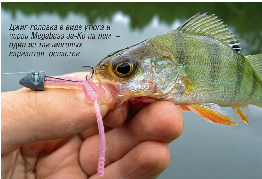
Джиг-головка в виде утюга и червь Megabass Ja-ko на нем – один из твичинговых вариантов оснастки.

Я намеренно объединил приманки и тип проводки, потому что главное в микроджиге – анимация приманок. У меня есть любимые проводки и приманки, которые