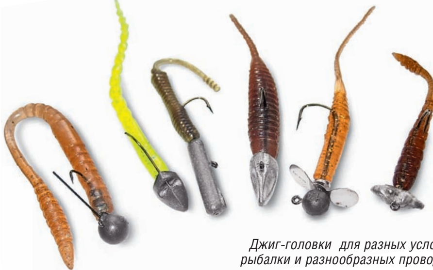
Джиг-головки для разных условий рыбалки и разнообразных проводок.

Лучшая джиг-головка для ловли в коряжнике и других сложных условиях – Nogales Hooking Master Inch Jighead. Последние два года я провожу отпуск в од-