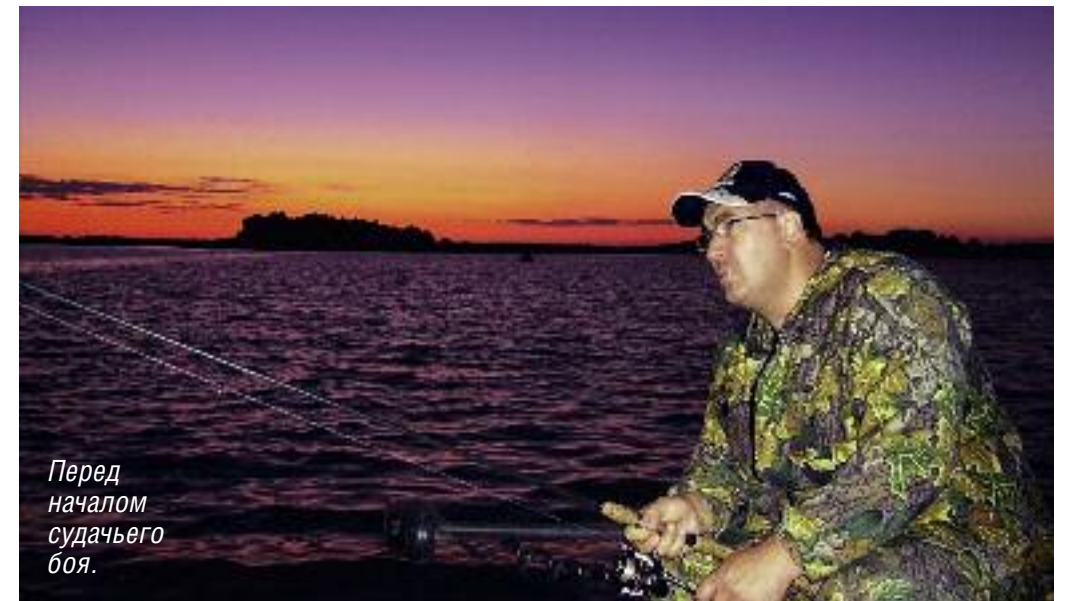
Перед началом судачьего боя.

Впечатления, полученные накануне, не давали покоя. Еще бы, поймать за одну рыбалку трех увесистых судаков, за которыми днем нужно сходить 20-30 раз, наводит на разные мысли. Например, утром ловить судака на ямах мне всег-да лучше удавалась, чем вечером. Конечно, это могут быть особенности водоема, но почему бы не проверить? Итак, еще крошечная темнота, а я уже на бе-