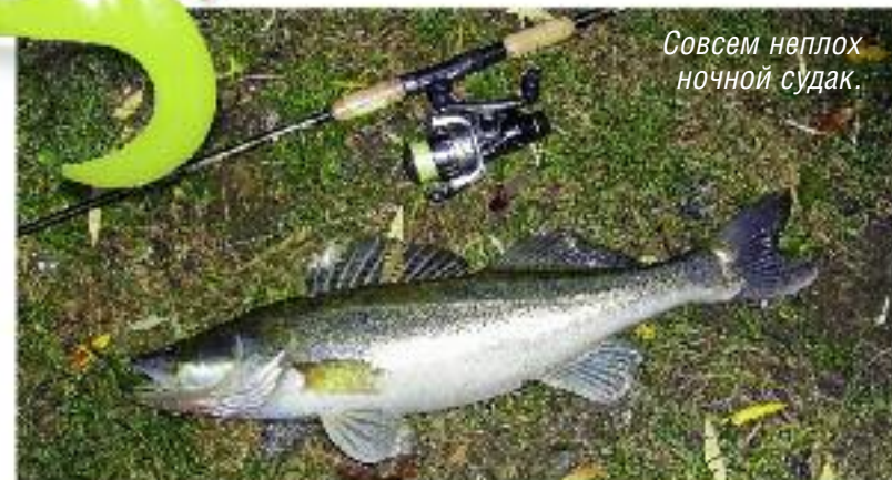
Совсем неплох ночной судак.

Доступный и уловистый минимум: JMBO PARAMAX, Mann's Predator, Relax на офсетных крючках-«незацепляйках» Mister Twister Weighted Keeper Kahle hook и на джиг-головках Stand-Up.