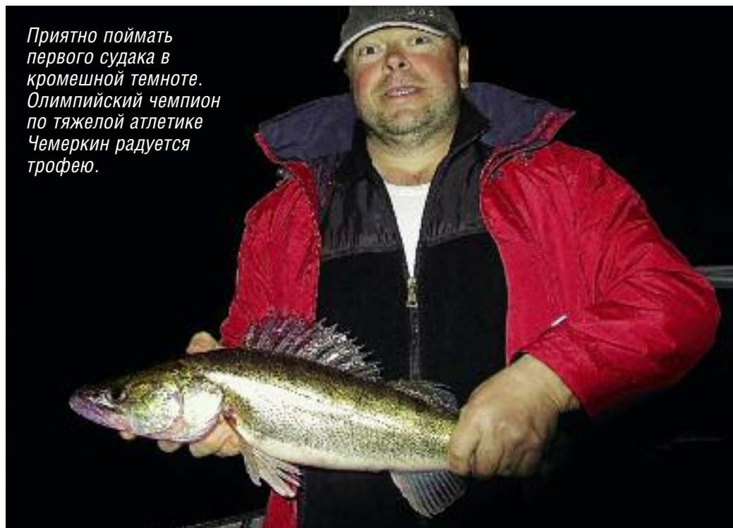
Фото: автор (6)

Приятно поймать первого судака в кромешной темноте. Олимпийский чемпион по тяжелой атлетике Чемеркин радуется трофею.