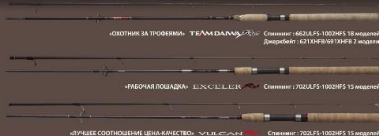
«ОХОТНИК ЗА ТРОФЕЯМИ» TEAM DAIWA EXCALIBUR Спиннинг : 662ULFS-1002MHFS 18 моделей Джеркбейт : 621XHFB/691XHFB 2 модели