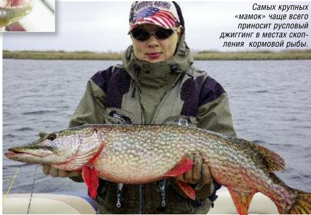
Фото: автор (7)

Много ориентиров для поиска участков в подобной ловле не нужно. Важно наличие глубины. На Волге – это трубы, канавы и ямы глубиной до 25 м, в средних водоемах и отдельных протоках Волги – до 13-15 м. Желательно также, чтобы на этой глубине присутствовали скопления глубинной кормовой рыбы: густеры и подлещика. Их косяки отлично видны на экране эхолота в виде непробиваемой плотной массы вблизи дна. Стаи «белой»