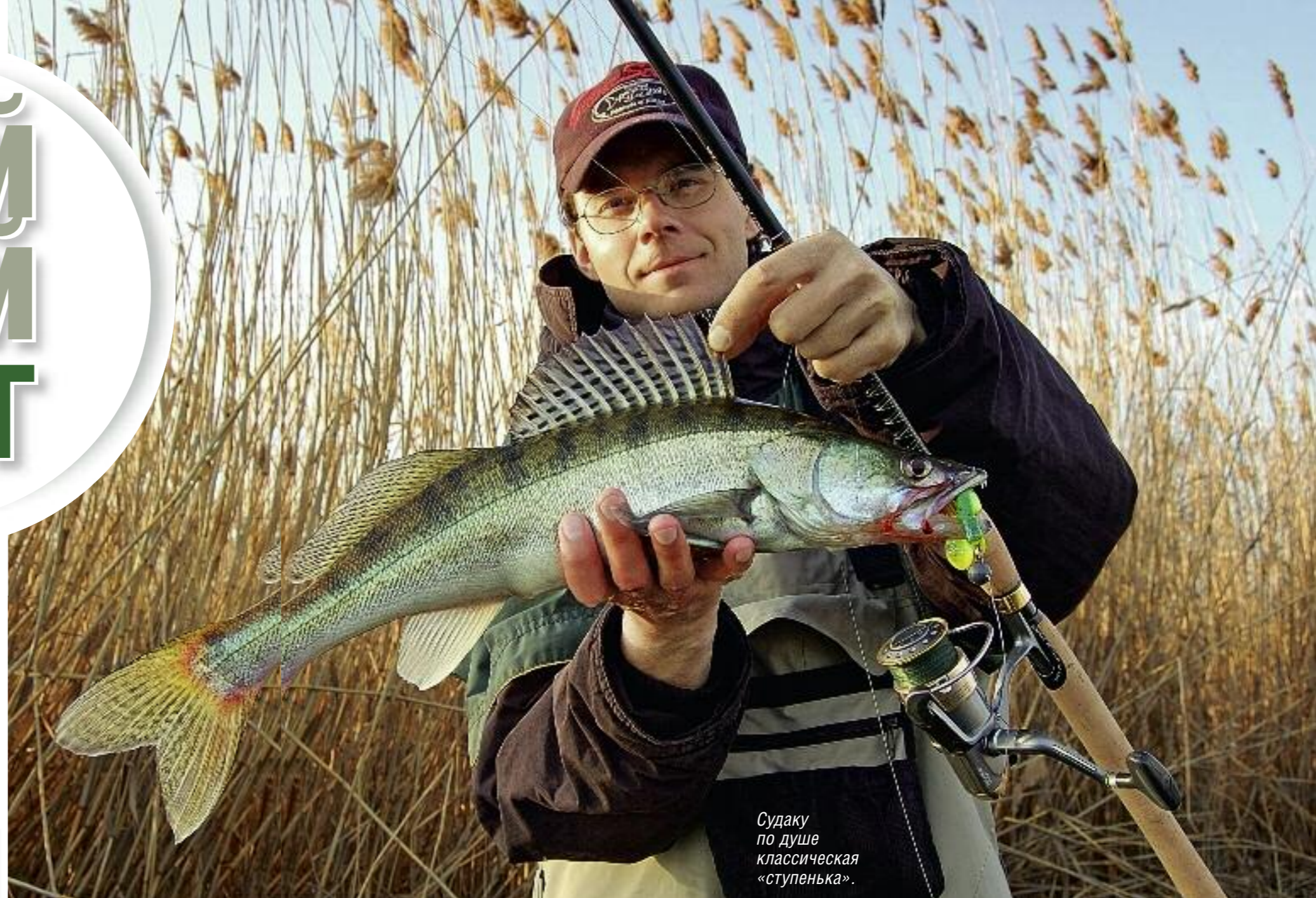
Судаку по душе классическая «ступенька».

нато придавать движениями удилища, а катушкой лишь выбирать слабины лески. У нас популярен катушечный подброс приманки над дном при почти неподвижном удилище. В последнее время спектр проводок неустанно расширяется. В легкой джиговой ловле проводки порой бывают виртуозными, с активным участием и катушки, и удилища. Споры относительно того, что же такое джиг, уже, казалось бы, нет. Для большинства наших спиннингистов процесс джигования означает использование ступенча-