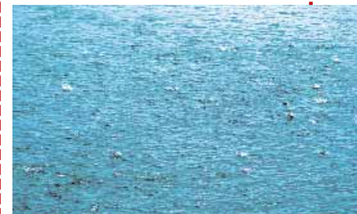
Стая скумбрии занята поглощением планктона. Поймать рыбу в это время нелегко.

Большинству норвежских рыболовных туристов это знакомо: когда ветер стихает, вода становится зеркально гладкой, тогда приходят сотни скумбрий, которые медленно плывут в непосредственной близости от берега, почти у самой поверхности воды. И что бы ни предлагали им в это время рыболовы — колеблющиеся блесны, воблеры, скумбриявые патерностеры — они не клюют! Обычно яростных, снабженных шипами мини-тунцов, которые на любой патерностер бросаются сразу втяпером, теперь не проймешь даже длительным шлепаньем приманкой по воде. Причина становится понятной, если все-таки удастся поймать одну скумбрию и исследовать содержимое ее желудка. Скумбрии пожирают, вернее, всасывают маленьких рачков и креветок, которые в теплой воде в свою очередь поедают крохотные зеленые и коричневые водоросли. Скумбрии проплывают через эту пищевую кашу, как киты через криль. Повезет тому, у кого в руке окажется нахлыстовое удилице. Маленькую мушку на крючке № 16 следует забросить в стаю рыб, и тогда можно рассчитывать на поклевку. Этого добиваются и с помощью маленьких колеблющихся блесен и лески диаметром 0,12 мм. В любом случае на тонкой снасти вам гарантировано яростное сопротивление скумбрии, которое, впрочем, абсолютно не помешает ее спеленничам, самозабвенно заглатывающим пищу.