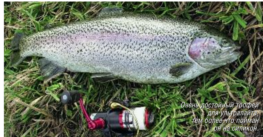
Очень достойный трофей для ультралайта, тем более что пойман он на силикон.

леблющиеся микроблесны и «вертушки». Но я решил провести эксперимент и попытаться поймать ее на силиконовую приманку. На «съедобные» виброхвосты форель никак не отреагировала. А вот рачка, движущегося в толще воды волнообразно, атаковала на третьей проводке. Единственная проблема была в том, чтобы забросить микроприманку с легкой головкой (1,5 г) на достаточное расстояние от берега. С воблой все получилось еще интереснее. Мне наскучило ловить ее фидером, и, вспомнив рассказы знакомых спиннингистов о ловле плотвы на микроголовки (скорее, мормышки) с кусочком силикона, я решил испытать эту снасть на вобле. С чем пришлось повозиться, так это с проводкой. При попытке применить волочение, как при ловле пассивного окуня, вобла клевала часто, но не засекалась. Видимо, рыба пробовала червя