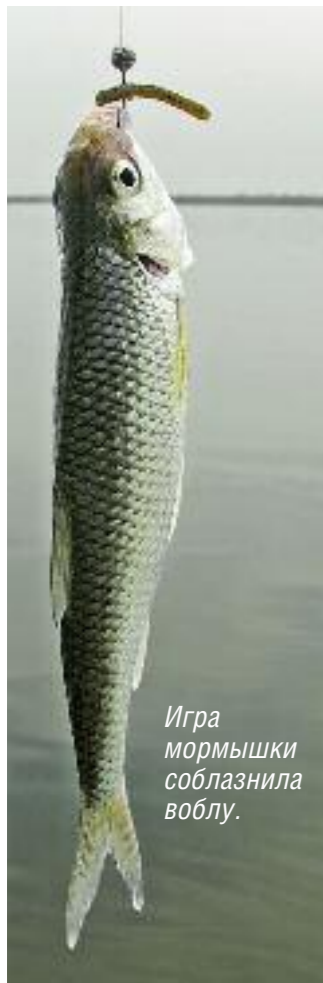
Игра мормышки соблазнила воблу.

маны за губу, то есть явно пытались съесть спиннинговую приманку. Несколько раз я случайно цеплял карпов и карасей за плавники крючком джиг-головки, но понятно, что такой «трофей» совсем неинтересен, хотя доставляет существенно больше хлопот во время борьбы.