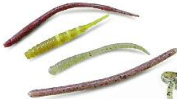
Реалистичный вид уловистых мягких приманок привлекает не только хищников.

водке в нужном месте поклевка бывает уверенной, что говорит о явном интересе рыбы к приманке. Наверное, чтобы ловить карпа на джиг регулярно, нужно заниматься только им, искать места жировок и ме-