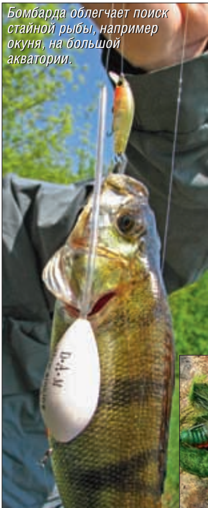
Бомбарда облегчает поиск стайной рыбы, например окуня, на большой акватории.

приманку на нужную дистанцию им никак не получается; тут бомбарда решает проблему. Благодаря бомбарде площадь облавливаемой акватории увеличивается в несколько раз, и это дает неоспоримое преимущество. К примеру, поиск точек концентрации стайной рыбы осуществляется гораздо эффективнее, если удастся за один заброс «прочесать» 60-метровый участок, а не выполнять забросы один за другим на короткую дистанцию, еще и перемещаясь при этом. Когда же рыба найдена, есть возможность избавиться от «посред-