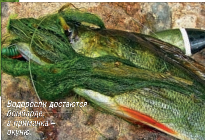
Водоросли достаются бомбарде, а приманка — окуню.

ника», но можно этого не делать. Когда я только начинал ловить на бомбарды, возникла мысль о том, что бомбарда будет сбивать игру воблера и отпугивать рыбу. На самом деле работа воблера не страдает. Твичинговая проводка, от очень агрессивной до медленных протяжек с паузами, будет почти такой же, как и при ловле без сбирулино. Лучшее всего при этом использовать медленно тонущую модель бомбарды, но если требуется быстро заглубить приманку, а проводка выполняется в быстром темпе, быстро тонущий