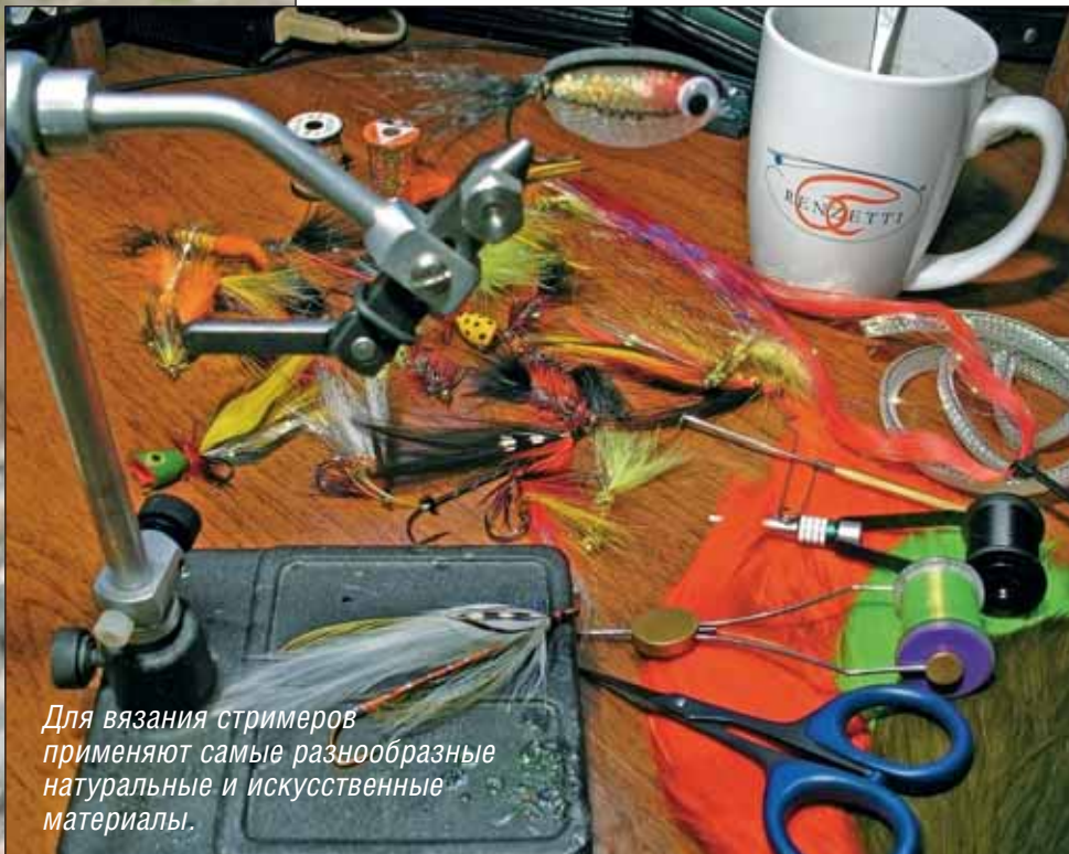
Для вязания стримеров применяют самые разнообразные натуральные и искусственные материалы.