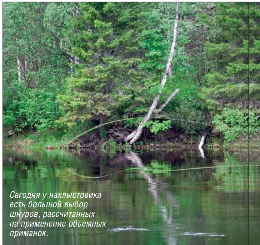
Сегодня у нахлыстовика есть большой выбор шнуров, рассчитанных на применение объемных приманок.

Что касается материалов для стримера, то сегодня существует немало мушек, связанных из пера страуса, бактейла или синтетики, способных создавать в воде солидный объем при незначительных габаритах. К тому же многие синтети-