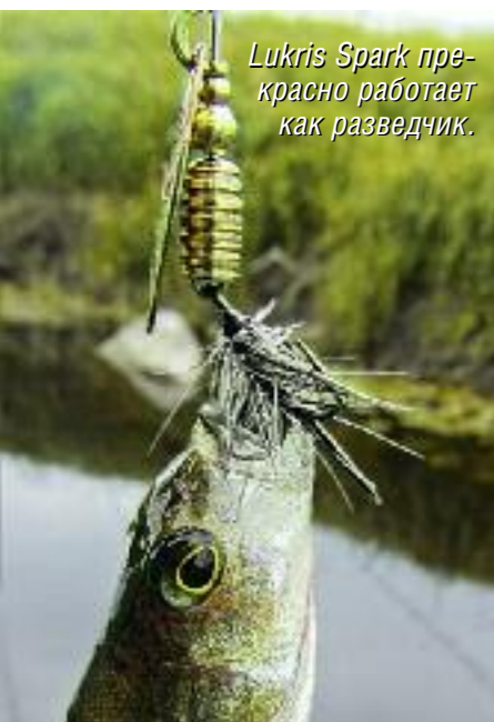
Lukris Spark прекрасно работает как разведчик.

А перспективными оказались поворот и мысок с внутренней стороны, за которым образовалась глубокая канава с не-