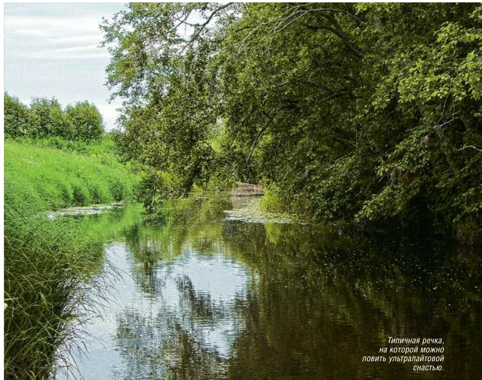
Типичная речка, на которой можно ловить ультралайтовой снастью.

В нашей стране имеются сотни маленьких речушек. Даже возле больших городов протекают вполне достойные речки в плане потенциальных трофеев, не говоря уже о водоемах, находящихся на приличном удалении от мегаполисов. Хотя рыба в них не очень пуганая, но, как правило, она и не крупная, а благодаря хорошей кормовой базе почти всегда сыта и разборчива. Соблазнить такую на поклевку не так-то просто. Здесь на помощь спиннингисту придут легкие удильца, тонкие лески и мелкие приманки.