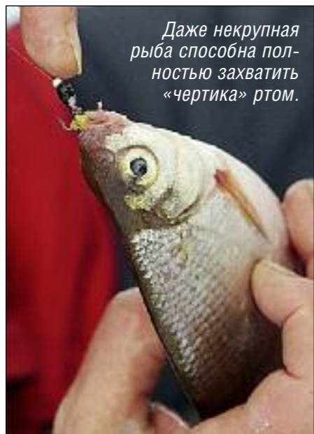
Даже некрупная рыба способна полностью захватить «чертика» ртом.