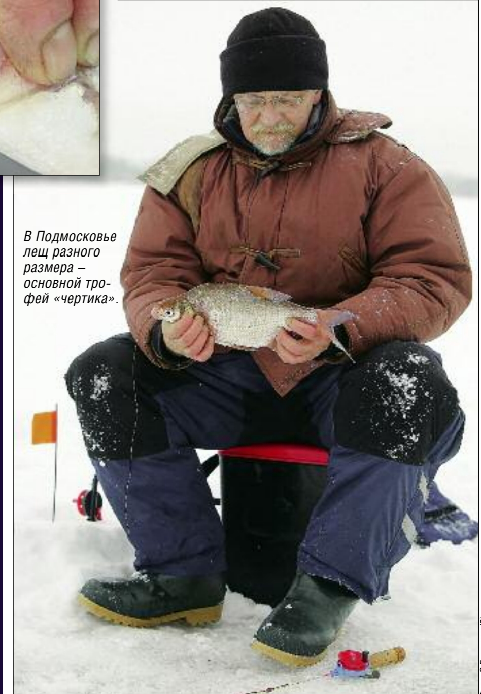
В Подмоскovie лещ разного размера – основной трофей «чертика».