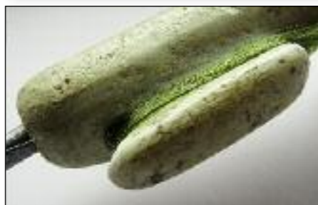
Чтобы леска сходила легко, края мотовильца полезно отшлифовать.

ку не приходится. Такая рыбалка просто идеальна для того новичка, которому надоело сидеть на морозе, медитативно уставившись на поплавок, и который страстно желает попробовать, а действительно ли ловится рыба на «чертика», причем вообще без мотыля. Тут вполне уместно заметить, что и по сей день многие рыболовы-зимники считают, будто ловля на «чертика» производится непременно с подсадкой либо мотыля, либо личинки репейной моли, либо еще какой-то натуральной приманки. Спешу их огорчить: смысла в