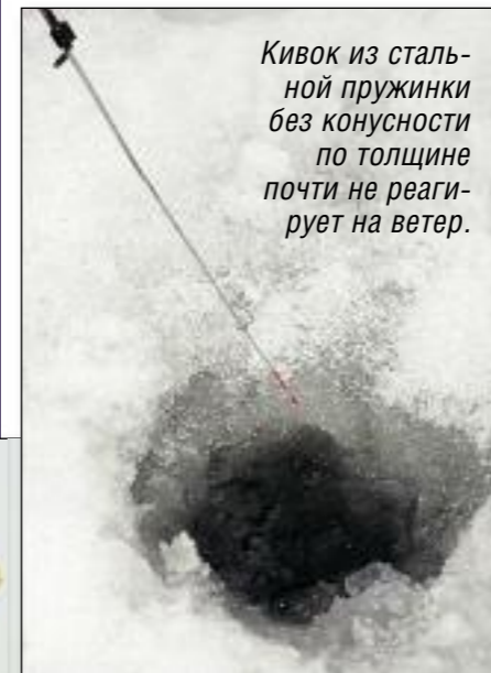
Кивок из стальной пружинки без конусности по толщине почти не реагирует на ветер.

Ловить на больших глубинах на «чертика» едва ли необходимо, хотя бывают исключения, в соответствии с которыми и выбирают общую длину лески. Настоятельно рекомендую применять только фторкарбонную (ФК) леску; она обладает двумя уникальными свойствами, которые так на руку рыболову-«чертятнику»: она не впитывает воду и является на 100% тонущей. Соответственно на нее не влияет мороз и она не мешает игре «чертика». Невидимость ФК-лески в воде имеет существенно меньшее значение, поскольку ловля на «чертика» происходит, как правило, на местах с глубиной более 2,5 м (например, для подлещика – на 7-9 м), где освещенность сильно падает и любая монотонность визуально становится малозаметной для рыбы. Диаметр 0,14 мм могут признать наиболее универсальным – прочности такой лески вполне хватает для спокойного вываживания рыбы массой 1-1,5 кг, а при умении и опыте можно взять