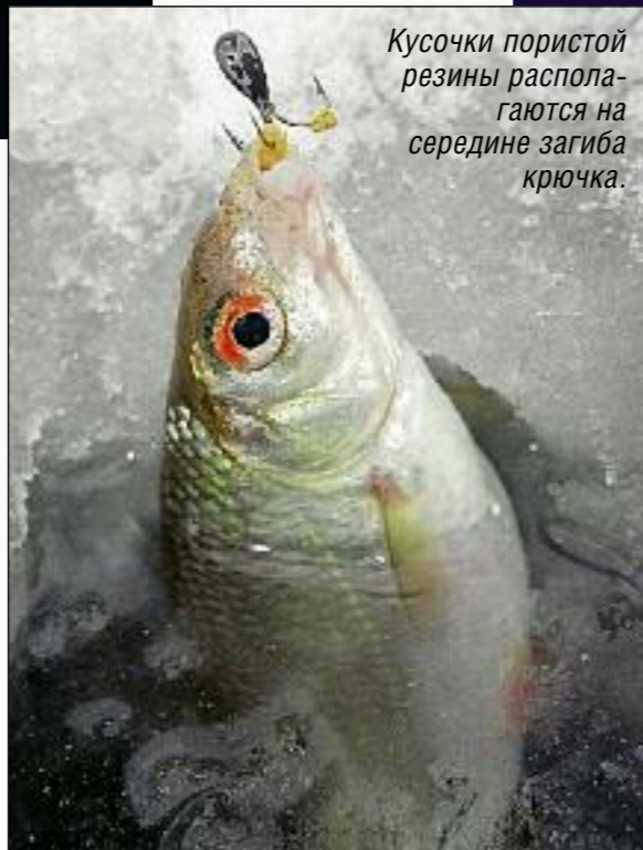
Кусочки пористой резины располагаются на середине загиба крючка.

Сейчас на прилавках столько разнообразных «чертиков», что только диву даешься, как такое «валовое количество» можно произвести на свет. Имеются приманки из монолит-