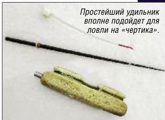
Простейший удильник вполне подойдет для ловли на «чертика».

площади примерно 100х100 м. Такая привязанность обусловлена либо каким-то уникальным рельефом дна, либо тем, что рыбаки давно известно, что здесь постоянно держится рыба. Правда, чаще случается все вместе: и место хорошее, и прикормить уже успели, удочки расставили, да и «вчера брало». Быстро перемещаться на таком «пяточке» нет смысла, постоянно подматывать и сматывать леску на катуш-