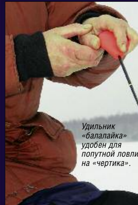
Удильник «балалайка» удобен для попутной ловли на «чертика».

рота замера глубины не критична, скорость подмотки-размотки лески при переходе с лунки на лунку – тоже. В этом случае наиболее удобен для рыбалки простейший удильник типа «кобылки». Имеет смысл брать с собой несколько удильников и оставлять у «проверенной» лунки, как бы занимая ее. Несмотря на примитивность, «кобылка» обеспечивает все, что нужно на рыбалке, да еще удивитель-