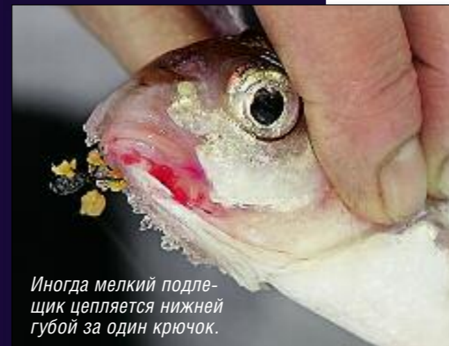
Иногда мелкий подлещик цепляется нижней губой за один крючок.

бая!) рыба не пройдет мимо него без реакции. Даже противный ерш размером чуть больше самого «черта» непременно толкнет его, о чем кивок тут же сообщит еле заметным, но вполне различимым сбоем в работе. Причем в случае с «чертом» реакция рыбы именно кормовая, а не по системе распознавания «что такое? кто такой?», поскольку в девяти случаях из десяти практически вся эта приманка