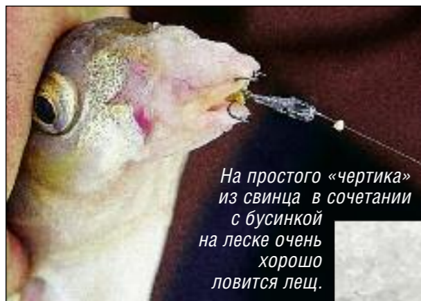
На простого «чертика» из свинца в сочетании с бусинкой на леске очень хорошо ловится лещ.