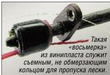
Такая «восьмерка» из винилпласта служит съемным, не обмерзающим кольцом для пропуска лески.