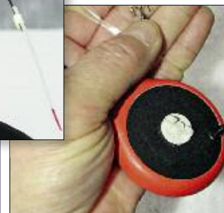
Пропуск лески в отверстие посередине кивка сильно ухудшает плавность игры «чертиком».

Когда приходится переходить от лунки к лунке, леску можно не наматывать на катушку.