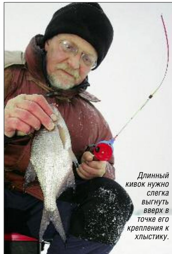
Длинный кивок нужно слегка выгнуть вверх в точке его крепления к хлыстику.

быстро намотать леску, а при подаче «черта» в лунку она сходит нетугой пружинкой, как с маленьких катушек. Многие рыболовы сами делают подобные удильники, но с рукояткой, изогнутой под небольшим углом относительно шестика; ими очень удобно работать, наклонив шестик почти перпендикулярно ко льду. Шестики для «мастеровых» удильников предпочтительны из углепластика, хорошо работают на морозе вершинки от фидера, подрезанные с тонкой части на 10-15 см, смотря по модели. Такой длинный шестик позволяет подсекать очень коротким движением кисти, не поднимая предплечья, что при конкуренции со стороны «собратьев по цеху» делает это движение почти незаметным и