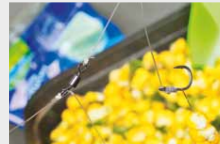
5. Оставьте смесь постоять ночь, прежде чем насаживать приманку на волосяную оснастку.