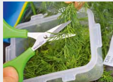
2. Сначала нарежьте ароматный укроп маленькими кусочками.