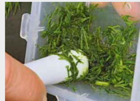
3. Измельчите его в ступке; при этом из него выступит сок.