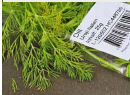
1. Укроп – «секретное оружие» при ловле белых амуров.