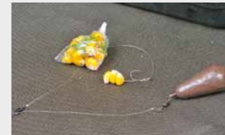
6. С помощью оснастки с грузилом на боковом поводке вы получите эффективный сигнализатор поклевки.

ли рыб уже часто вылавливали. К тому они же крайне пугаются поводка. Флуорокарбон в этих случаях, к сожалению, может оказаться не слишком эффективным. Даже когда поводок лежит на поверхности, амур его все равно видит. Здесь поможет только такой поводок, который вообще не соприкасается с водной поверхностью. Целесообразно использовать специальный поверхностный пилот, так называемый Kruiser. Благодаря ему конец лески, который ведет к крючку, приподнимается вверх и поначалу вообще не входит в контакт с поверхностью. Если же вы используете плавающую основную леску и она, слегка свернувшись в кольца, лежит на поверхности, даже острый глаз белого амура ничего не заподозрит. Для поверхностной ловли я обычно использую корочки хлеба или хлебный мякиш. Эти приманки не только устойчивы к мощным забросам, но еще очень хорошо и долго плавают. А рыбы сразу воспринимают их как пищу без долгих фаз привыкания.