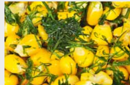
4. Смешайте измельченный укроп с предварительно отваренной жесткой кукурузой.