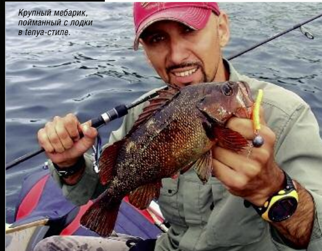
Крупный мебарик, пойманный с лодки в тенью-стиле.