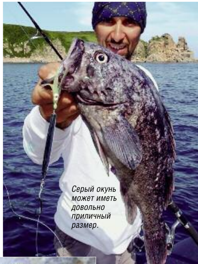
Серый окунь может иметь довольно приличный размер.

Неизбежно возникает вопрос о приманках и монтажах. Помимо всего джигового, применяемого для такой ловли (я имею в виду шарнирные монтажи, специальные джиг-головки для донной ловли и ловли в толще воды, легкий «техас» и варианты дропшота и сплитшота), следует попробовать кое-что необычное. Это