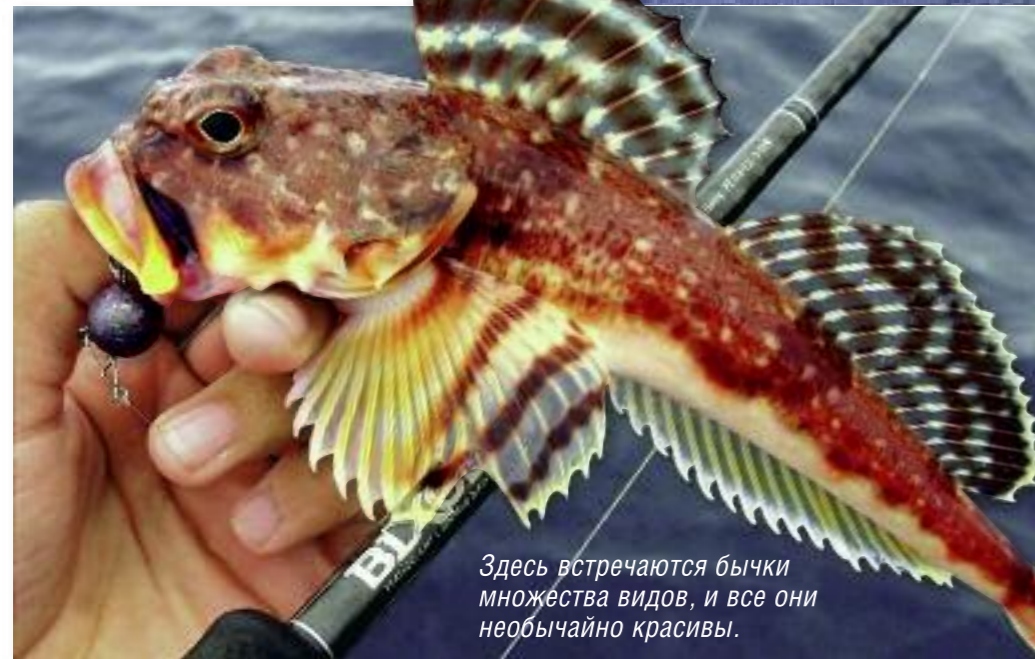
Здесь встречаются бычки множества видов, и все они необычайно красивы.

Солидные вершинки хороши для ловли на джиг и всевозможные монтажи типа инчику (inchiku) или мадай-джигов (madaï jigs) с контролем дна.