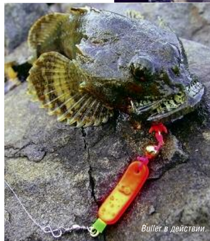
Buller в действии.

Оснастки burakuri – очень интересные варианты донных монтажей – совсем недавно появились на свет в каталогах Fujiwara.