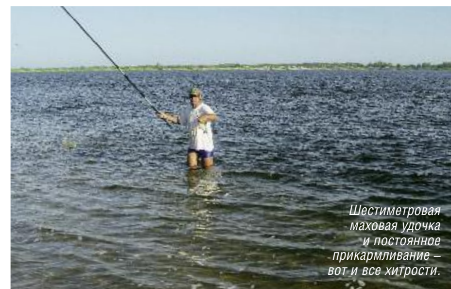
Шестиметровая маховая удочка и постоянное прикармливание – вот и все хитрости.