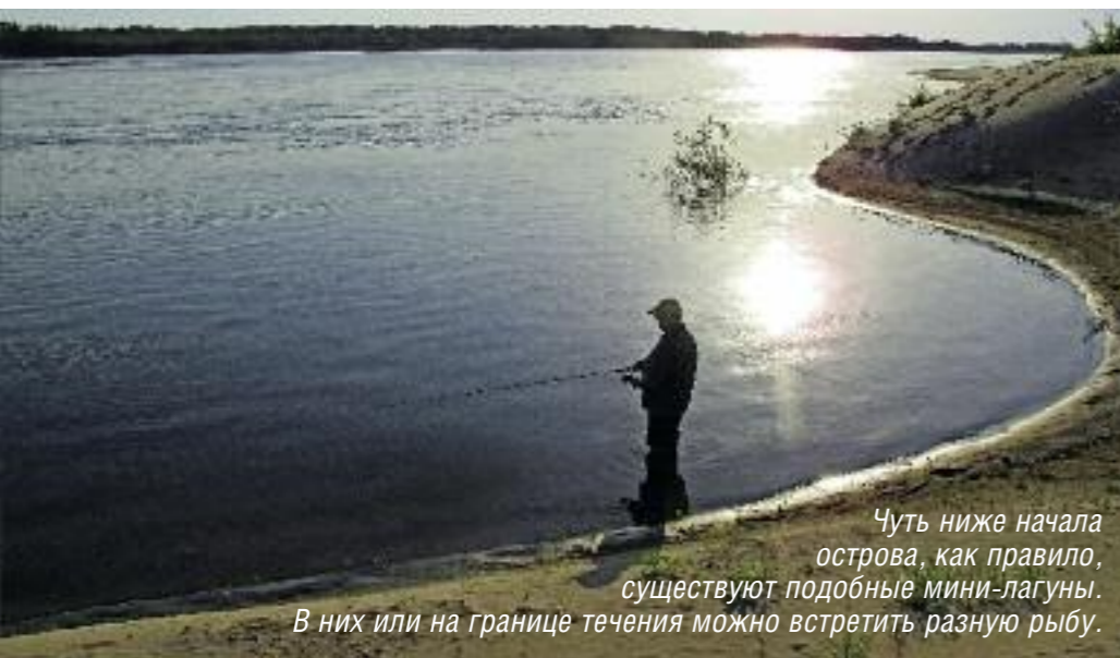
Чуть ниже начала острова, как правило, существуют подобные мини-лагуны. В них или на границе течения можно встретить разную рыбу.

волна, идущая перед ним. Завидя подобную картину, не приближаясь к берегу, надо сделать заброс «с упреждением», чтобы приманка оказалась в поле зрения жереха на пути его следования. Атака крупного жереха на мелководье незабываема. Даже если это произошло всего лишь однажды за утро, это уже награда. Ничего подобного при ловле жереха с лодки вы не увидите.