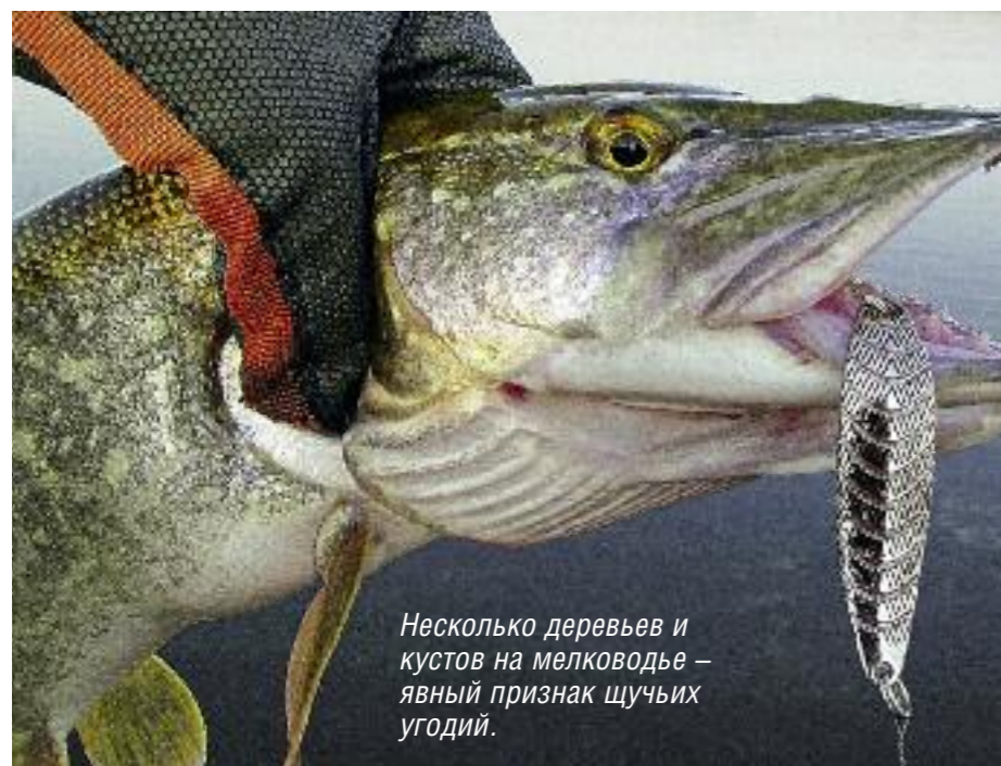
Несколько деревьев и кустов на мелководье – явный признак щучьих угодий.

Когда течение, вымывая песчаный берег, натывается на закрепившиеся корнями за глиняный пласт кусты, образуется очень красивая суводь.