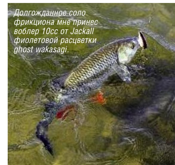
Долгожданное соло фрикциона мне принес воблер 10сс от Jackall фиолетовой расцветки ghost wakasagi.