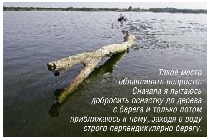
Такое место облавливать непросто. Сначала я пытаюсь добросить оснастку до дерева с берега и только потом приближаюсь к нему, заходя в воду строго перпендикулярно берегу.

волна, идущая перед ним. Завидя подобную картину, не приближаясь к берегу, надо сделать заброс «с упреждением», чтобы приманка оказалась в поле зрения жереха на пути его следования. Атака крупного жереха на мелководье незабываема. Даже если это произошло всего лишь однажды за утро, это уже награда. Ничего подобного при ловле жереха с лодки вы не увидите.