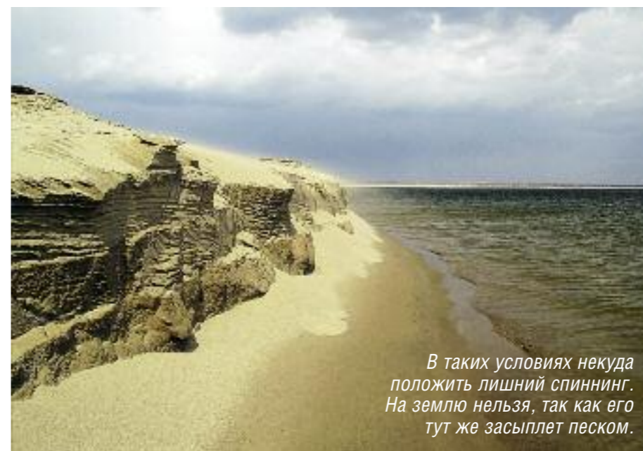
В таких условиях некуда положить лишний спиннинг. На землю нельзя, так как его тут же засыплет песком.

Оказавшись на острове, всегда немного ощущаешь себя литературным героем из известного романа Даниэля Дефо. Нас так и подмывает пройти как можно дальше по побережью, посмотреть, что прибой выбросил на берег за ночь, понаблюдать за прибрежной жизнью птиц, ящериц и лягушек, посмотреть, что там за мысом. Вот так и я однажды побрел бо-