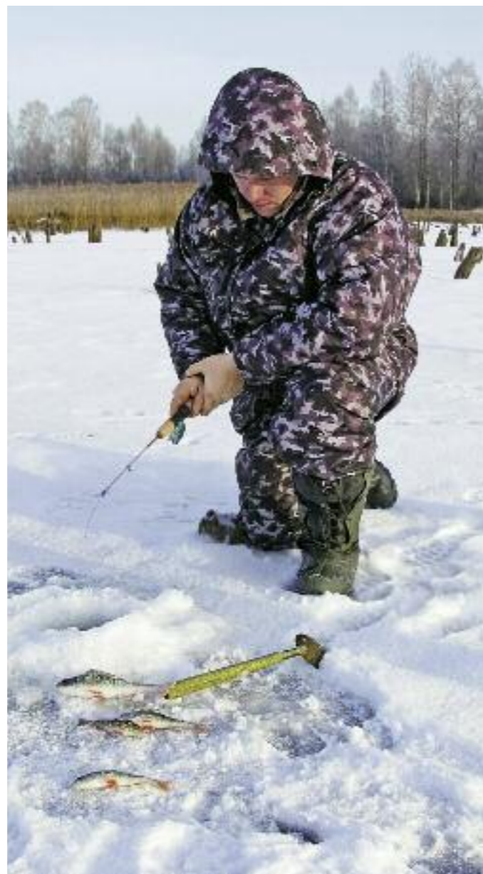
При капризном клеве безнасадочная приманка незаменима.

Стаи крупного окуня обычно держатся вблизи кормовых участков, особенно там, где есть скопления малька. Это могут быть неглубокий полив с отдельными коряжинами на дне, с различными неровностями в виде ямок, бугров, а также чем-то привлекающие окуня точки вблизи затопленного русла (когда оно близко прижимается к берегу). Стаи крупного окуня могут стоять и по краям вытянутых каменисто-песчаных или глинисто-песчаных кос. Любят они держаться и у островов возле береговой зоны, особенно на отмелях вокруг них и на бровках за островами. Всегда нужно уделять внимание исследованию закоряженных зали-