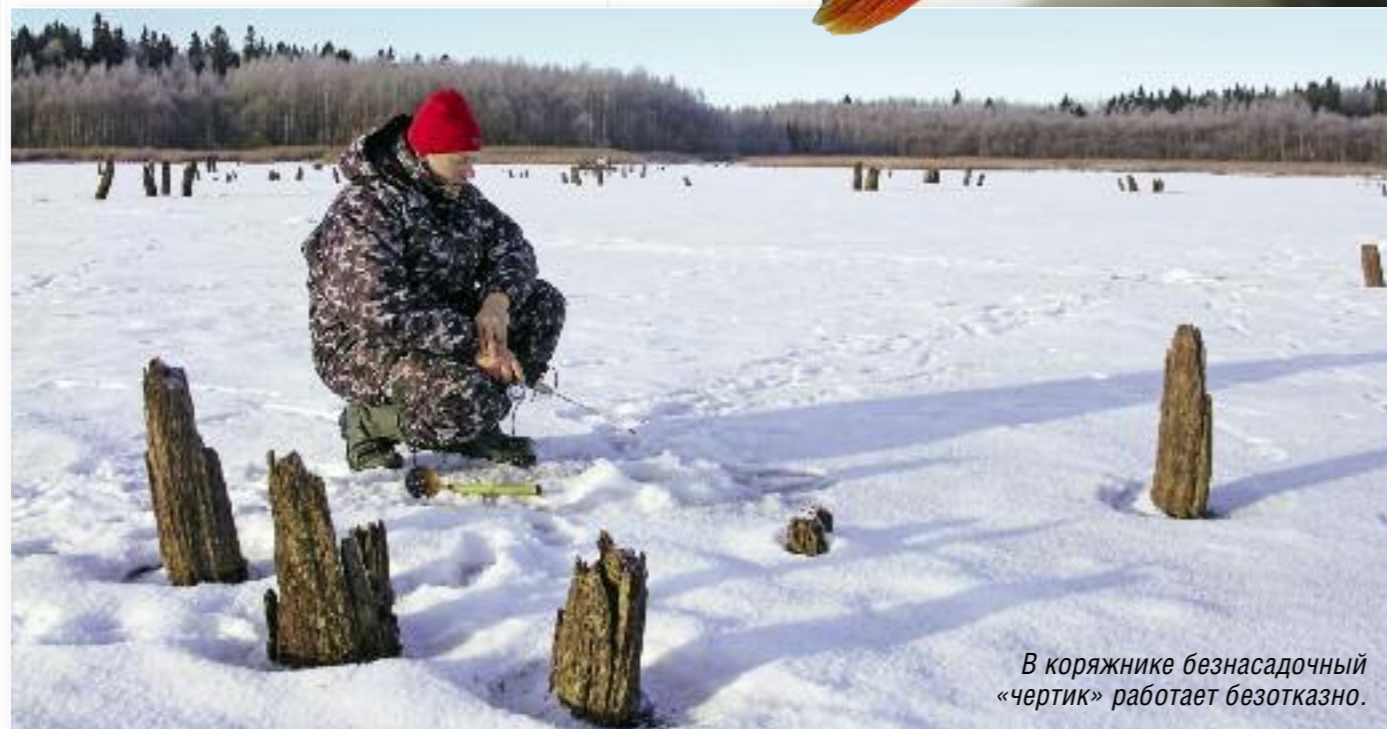
В коряжнике безнасадочный «чертик» работает безотказно.