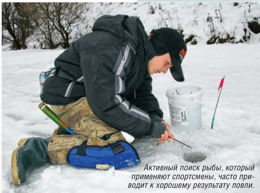
Активный поиск рыбы, который применяют спортсмены, часто приводит к хорошему результату ловли.