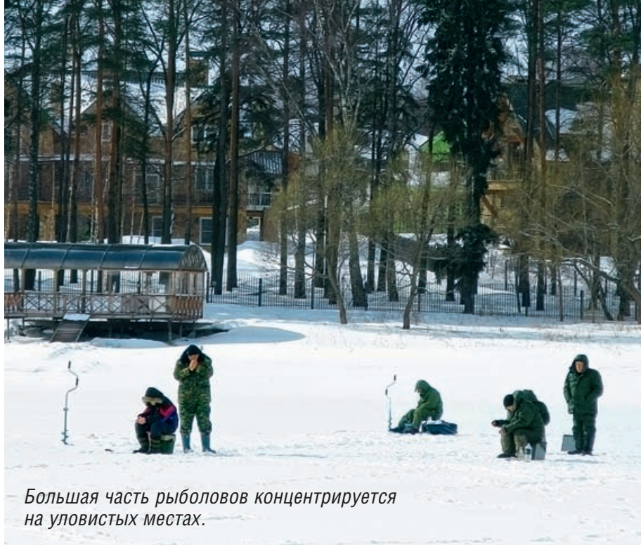
Большая часть рыбаков концентрируется на увалистых местах.