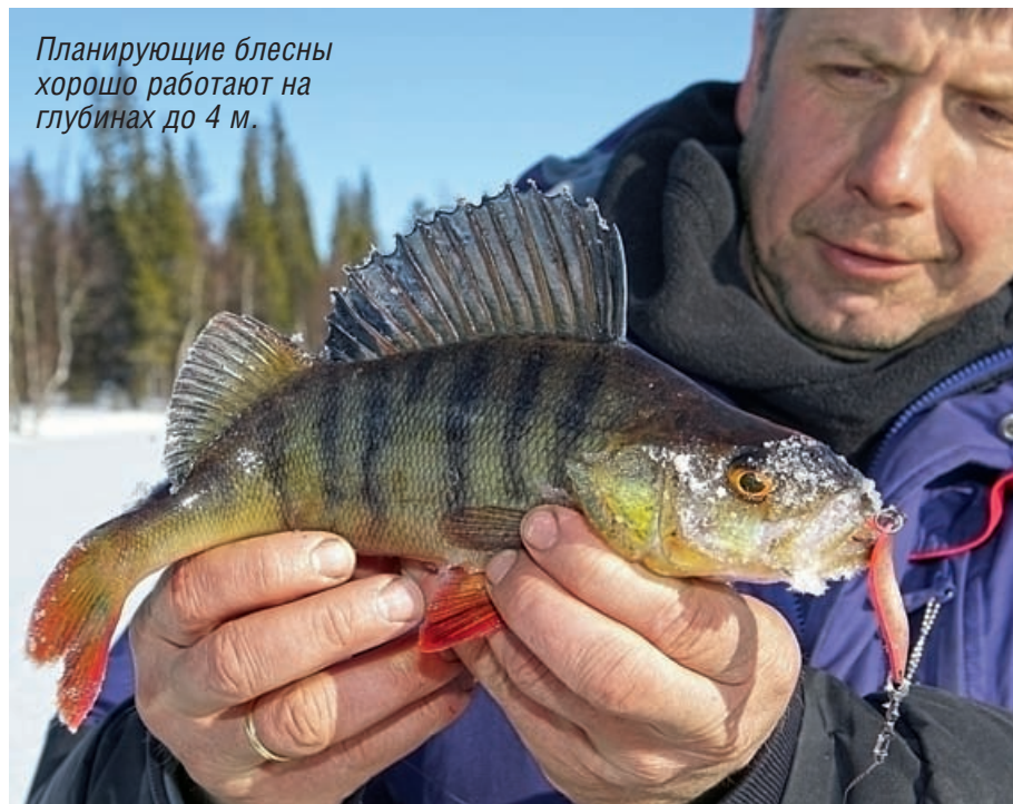
Планирующие блесны хорошо работают на глубинах до 4 м.

ляющая собой овал размером 20x10 мм с припаянным одинарным крючком. Концы ее чуть заужены, а напайка олова вблизи крючка минимальная. Это позволяет блесне плавно уходить в сторону, производя колебания, привлекающие хищника. Вообще, отклонение планирующей блесны от вертикали во многом зависит от распределения припоя на ее внутренней стороне. Чем большая его масса сконцентрирована в передней части, тем больше у блесны шансов принять горизонтальное положение и уйти в сторону. Кроме того, выгибание металлической пластины, из которой изготовлена блесна, может дополнительно улучшить ее планирующие способности. Не-