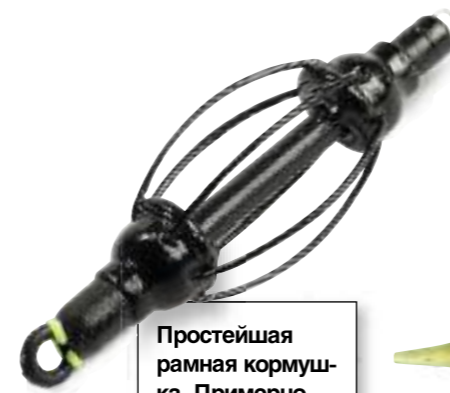
Простейшая рамная кормушка. Примерно с таких начинался «Method».