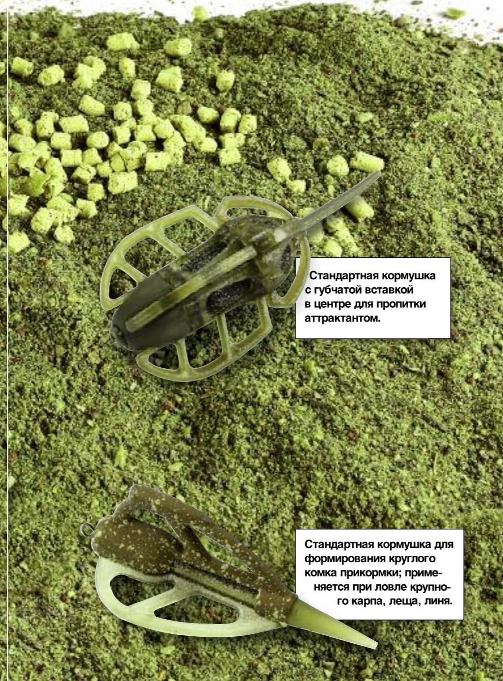
Стандартная кормушка с губчатой вставкой в центре для пропитки аттрактантом.