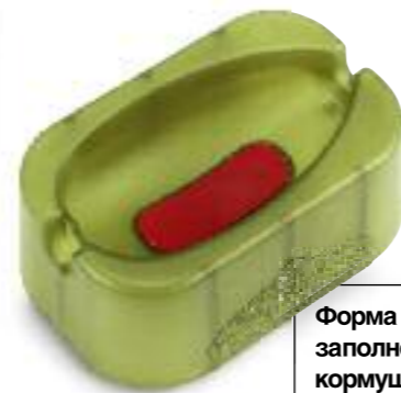
Форма для заполнения кормушки с плоским дном.