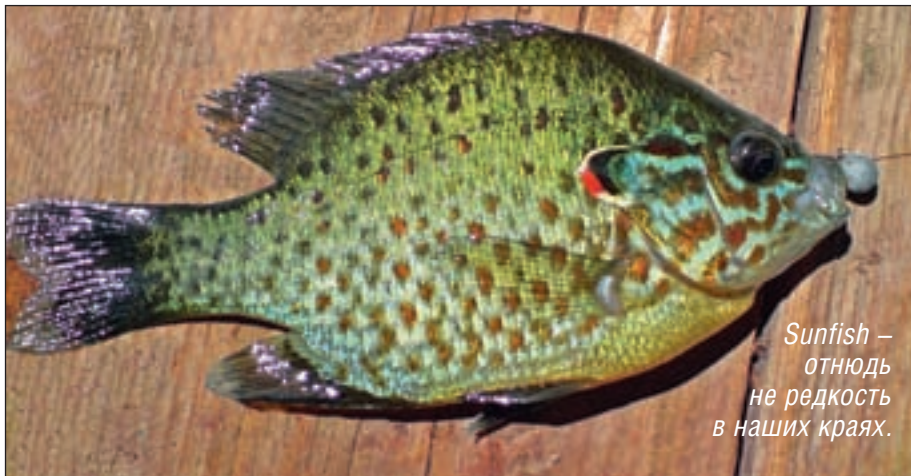
Sunfish – отнюдь не редкость в наших краях.

и перекатами. В подобных условиях целесообразно обловить микроджигом ямки глубиной 3-4 м, которые чаще всего находятся ниже перекатов. Там вас могут ожидать не только окунь, судак и щука, но и жерех, голавль и язь.