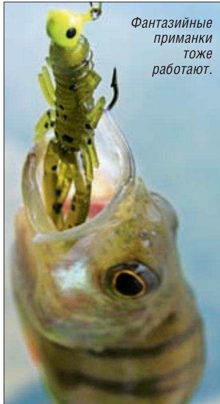
Фантазийные приманки тоже работают.

Пример 3. Небольшая река с достаточно быстрым течением, средними глубинами около 1,5-2 м, каменистыми берегами