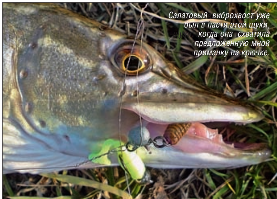
Салатовый виброхвост уже был в пасти этой щуки, когда она схватила предложенную мной приманку на крючке.

Очень интересна летняя ловля микроджигом красноперки. Стоит она обычно рядом с зарослями водных растений, поэтому описанные выше проводки вряд ли получатся, да они и не нужны. Поставьте 1-2-граммовую джиг-головку с мелким крючком, дюймовый твистер и осуществляйте равномерную, волнообразную или с короткими остановками проводку, так чтобы приманка не успевала зарыться в траву. Ловля эта живая и азартная, поскольку обычно красноперка очень активно реагирует на приманку. Иногда случаются и сюрпризы в виде щуки на 2-3 кг, покусившейся на крохотный микроджиг, или частых в наших краях и не менее красивых американских солнечных окуней (sunfish).