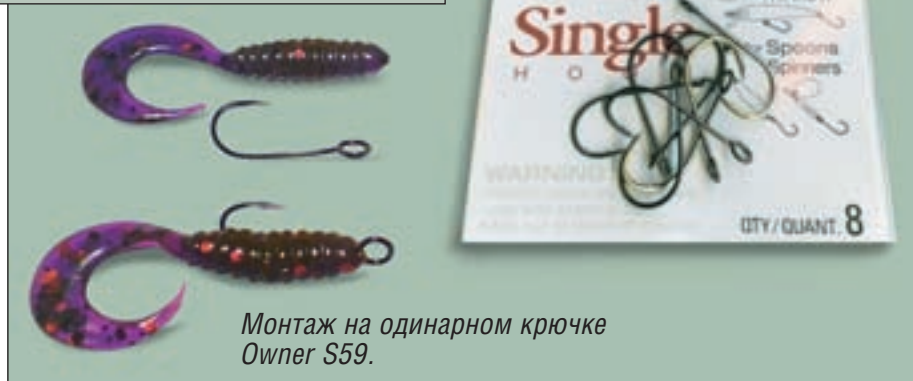
Монтаж на одинарном крючке Owner S59.

ло раз в пять больше. Разница была только во флуорокарбоне, которого у меня с собой не оказалось. На следующий день я поставил флуорокарбонный поводок и дело пошло заметно веселее. С тех пор при ловле окуня микроджигом я всегда ставлю поводок длиной 40-60 см из флуорокарбона Sunline Rockbite диаметром 0,165 мм. При ловле щуки периодически использую поводок такой же длины, но из толстого флуорокарбона (Toray 0,41 мм); это увеличивает время падения приманки на паузе, что в некоторых ситуациях бывает полезно. Кстати, в тихую погоду в руку на паузе отчетливо передается нечто вроде жужжания или звона – вы чувствуете, как толстый флуорокарбон разрезает воду. Таким образом можно контролировать проводку приманки любой массы, смотря при этом по сторонам или вообще закрыв глаза. Несколько слов о катушках . От катушки в микроджиге требуются лишь безупречная укладка максимально тонкого и