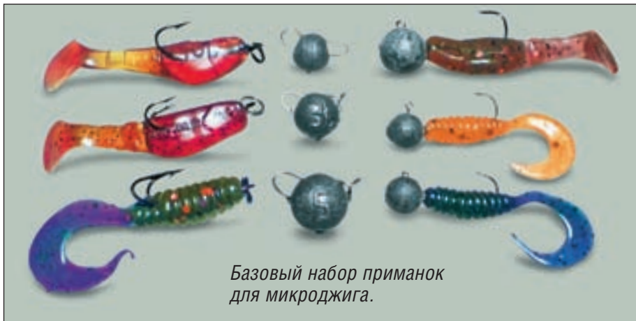
Базовый набор приманок для микроджига.

ко для достижения максимального заброса. В ситуациях, когда это не требуется, можно смело использовать монтаж на джиг-головке. Джиг-головка имеет преимущество в условиях большого количества зацепов, хотя, конечно, рыбу она держит хуже шарнирного монтажа на двойном крючке. Обычно используются джиг-головки с размером крючка № 2-12. Лучше всего зарекомендовали себя крючки Owner, Gamakatsu, Matzuo, Maruto и Hayabusa. Из двойников я обычно использую Owner, Gamakatsu и VMC размерами