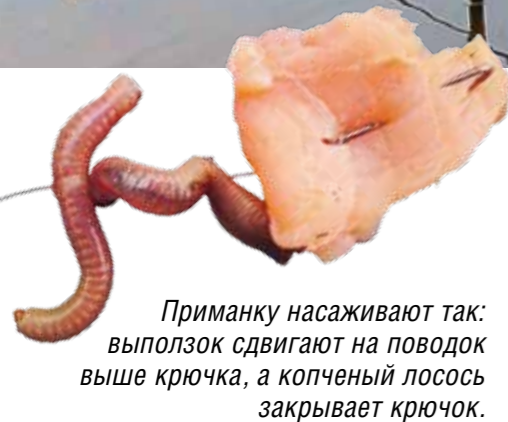
Приманку насаживают так: выползок сдвигают на поводок выше крючка, а копченый лосось закрывает крючок.

мер и измерить глубину. Когда поводок прилегает ко дну, осетру удается беспрепятственно взять приманку. Конструкция донной оснастки очень проста. На основной леске монтируют трубочку-противозакручиватель, которая предотвращает перехлесты и обеспечивает свободный сход лески. К вер-