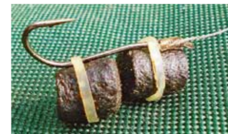
Осетровый пелетс можно смонтировать на крючке с помощью маленьких резинок.

На моем излюбленном форелевом озере часто уже через два часа бывает поклевка. Когда я в последний раз посетил водоем, первая рыба попала на поплавочную оснастку. После подсечки она сразу же сделала мощный бросок и выскочила из воды. Зрелище впечатляющее! Осетр был длиной примерно 1 м и массой около 4 кг. Вскоре после поимки он вновь обрел свободу. С наступлением ночи разразилась сильная