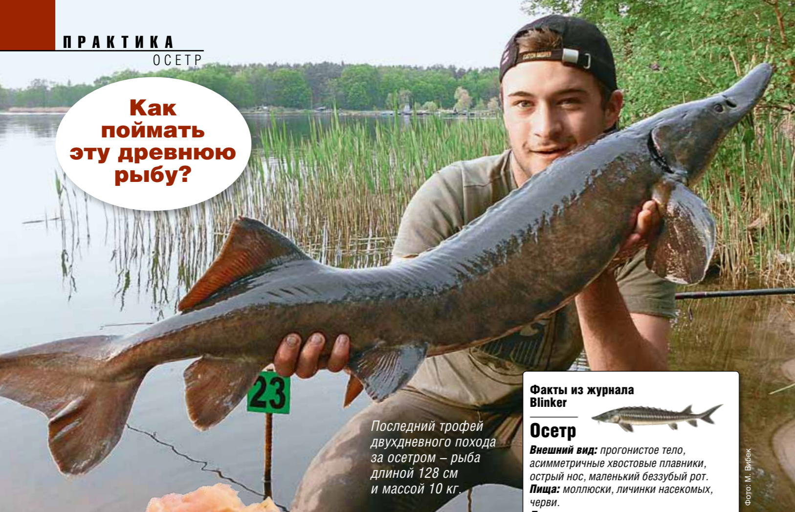
Последний трофей двухдневного похода за осетром – рыба длиной 128 см и массой 10 кг.