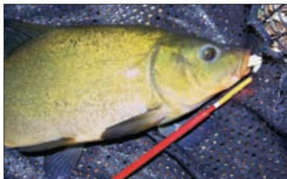
Рисунок: Р. Янке

То, что линь заинтересовался пучком опарышей на крючке, отчетливо отметил вагглер.