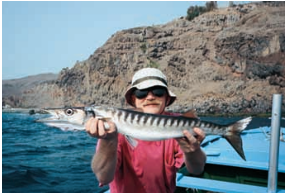
Несомненно, это полосатая барракуда, пойманная у Канарских островов.