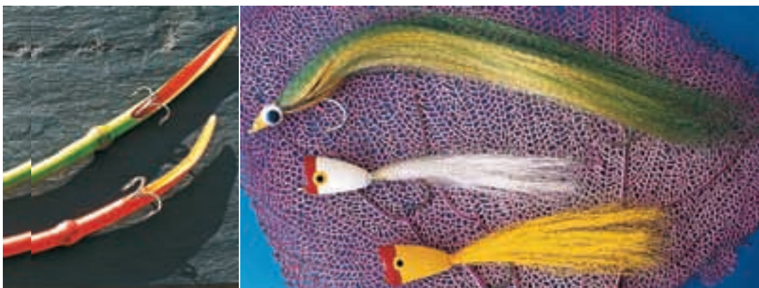
(справа) при быстрой проводке – хорошие приманки для ловли барракуды.

мной маленькая барракуда величиной с огурец нырнула в риф, и ее спина приобрела мраморную окраску. В этот момент слева в поле моего зрения стремительно выскочила большая барракуда невероятных размеров, схватила малышку поперек тела и умчалась со своей жертвой прочь. По сей день у меня перед глазами стоят гигантские лопасти ее мощного хвостового плавника, который перед моей маской ощутило колыхнул воду. Крупную барракуда я сначала не заметил. А ведь она подкарауливала добычу в непосредственной близости от меня. В Индийском океане при нырянии возле коралловых рифов я неоднократно видел на глубине более 20 м больших барракуд, но никогда это не было так близко и так драматично. Одну мою знакомую в Мексике во время лодочной прогулки укусила маленькая барракуда. Женщина хотела охладить руку и поболтала кистью руки в воде. В то место, где на пальце сверкало серебряное кольцо, и укусила маленькая барракуда, оставив сильно кровоточащую рану. И еще одна история, которую я пережил во время рыбалки. Я вываживал альбулу, которая убегала от меня в сумасшедшем темпе. Неожиданно в борьбу вмешалась большая барракуда. Облако пены и